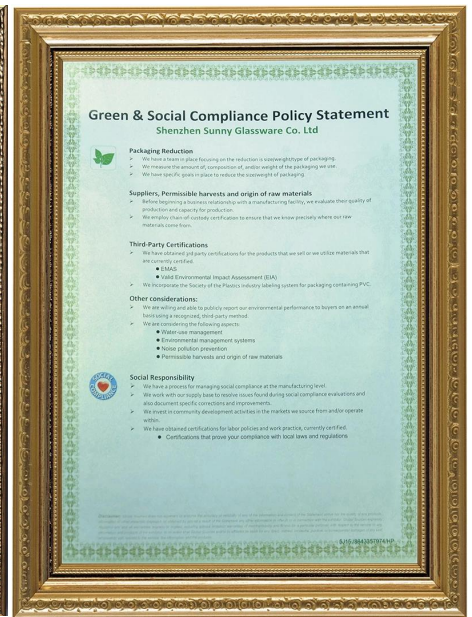
Tanggungjawab hijau dan sosial Penyataan Policy