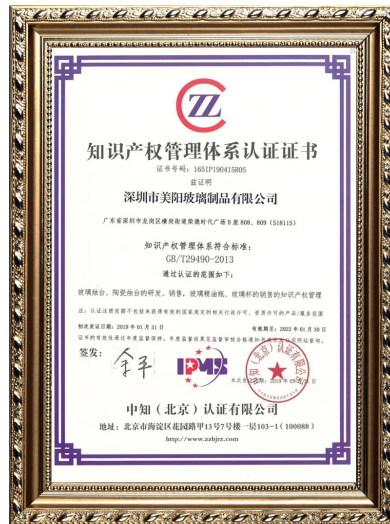
harta intelek korporat