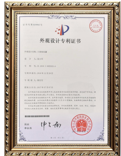
No. Paten: 201630655323.4