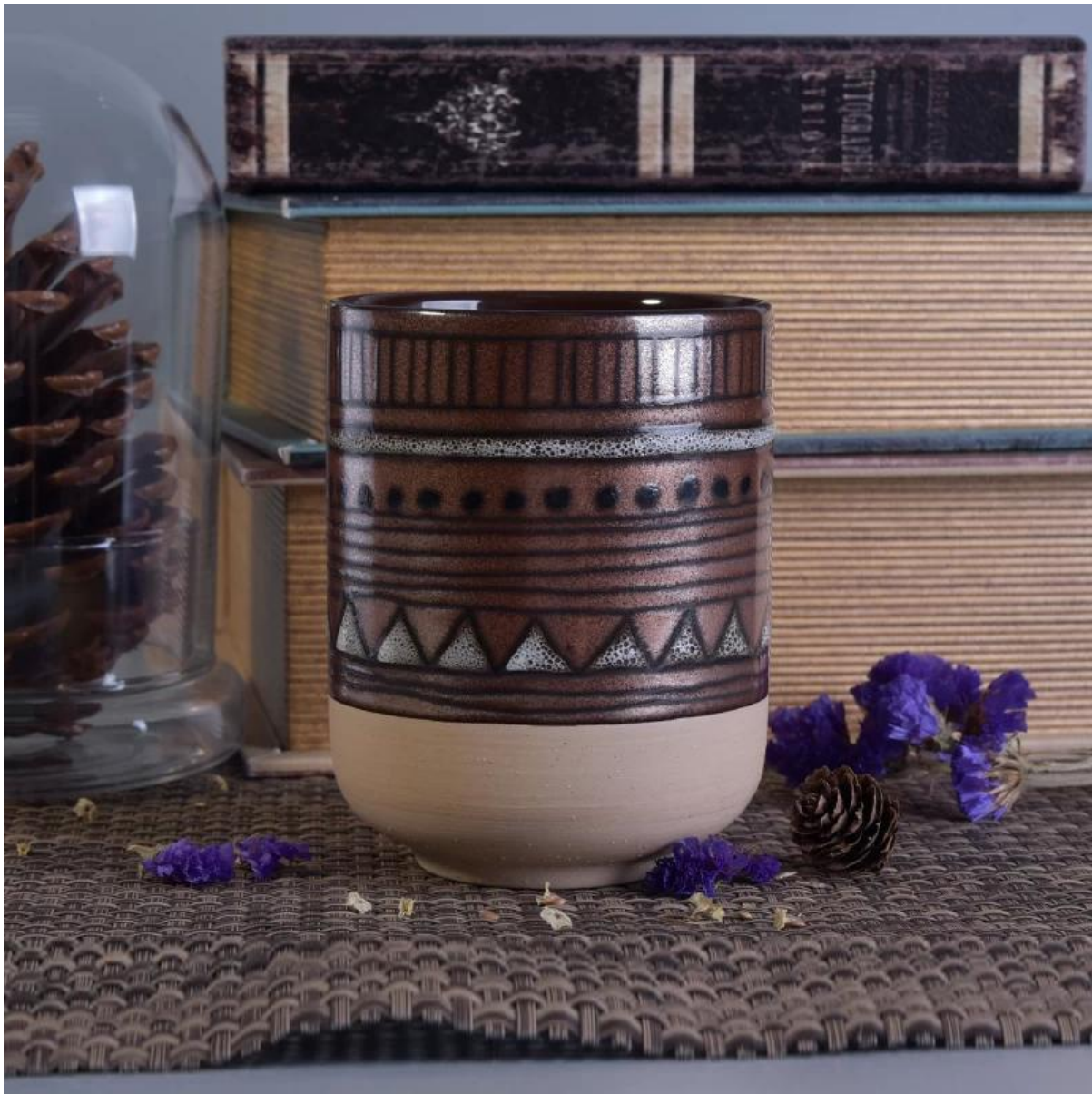
Aksesori yang dipadankan: