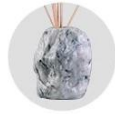
Water Transfer Printing