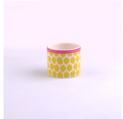
lukisan berwarna-warni pemegang lilin seramik