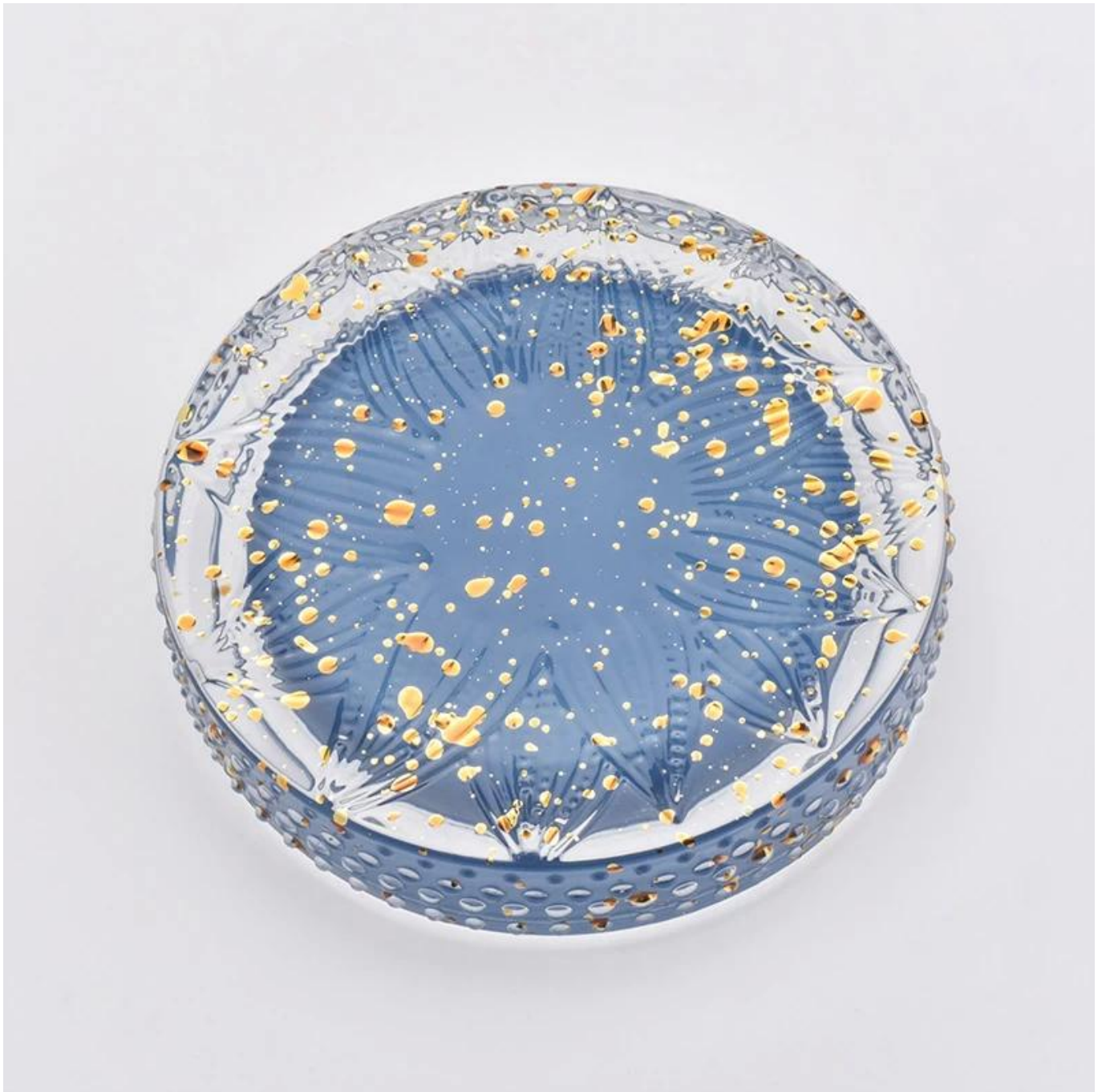
Range of the application