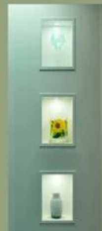
Mostra di fabbrica: