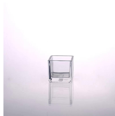
portacandele quadrato in vetro decorato per la casa