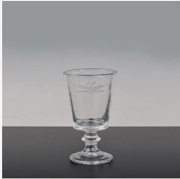
vetro portacandele derivava