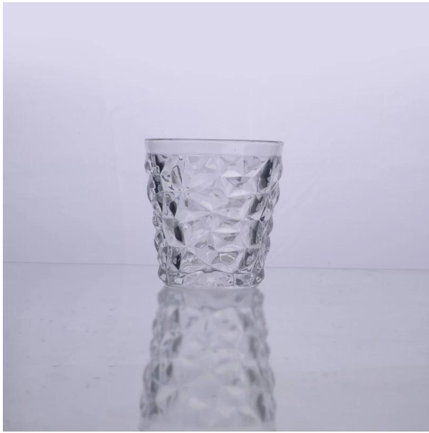
modello di supporto candler vetro