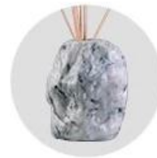
Water Transfer Printing