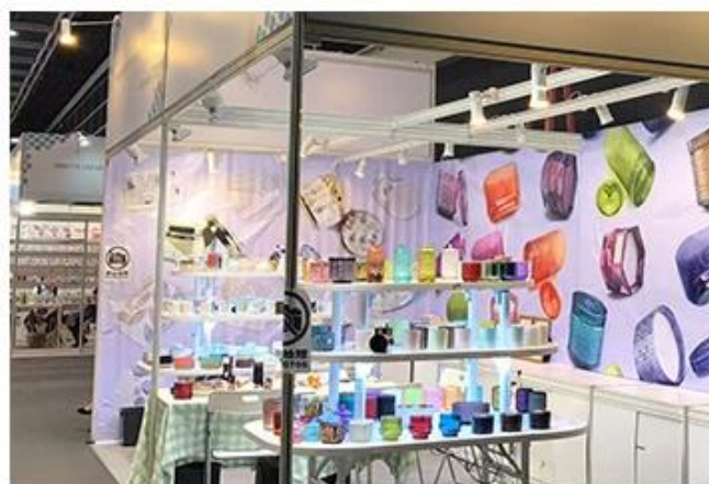
Fabbrica di ceramica