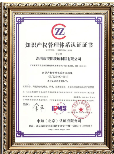
Proprietà intellettuale aziendale Brevetto n.: 201630655323.4