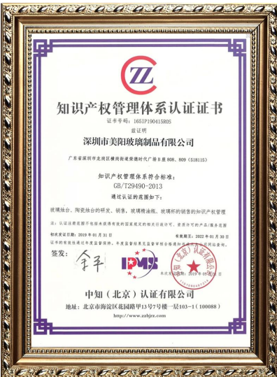
Proprietà intellettuale dell'azienda Numero di brevetto: 201630655323.4