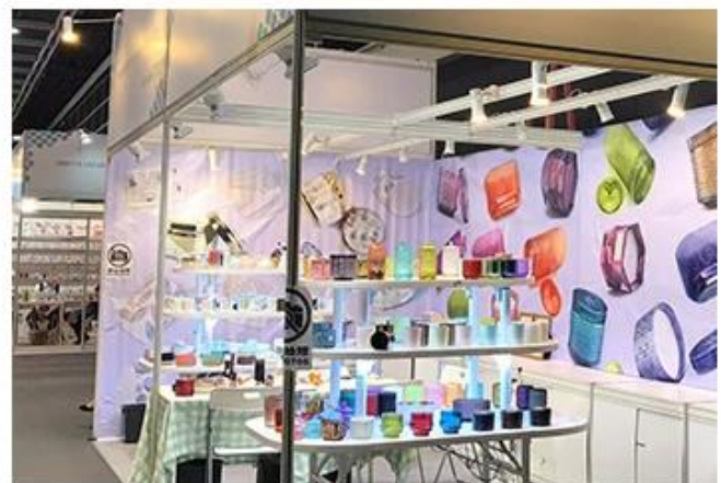
Fabbrica di ceramica