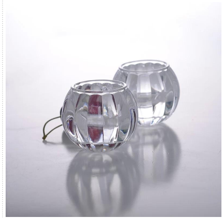
Titolare di candela Wedding

S Our Company & Sample Room Every day is sunny day