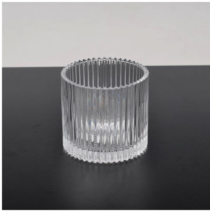
portacandele in vetro trasparente