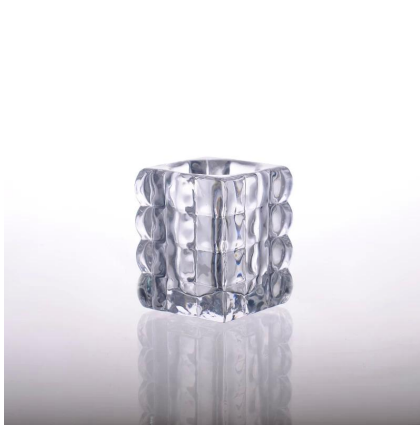
Portacandele di vetro quadrato