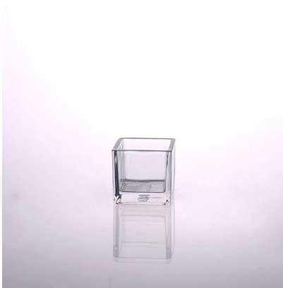
porte-bougies en verre carrée décor à la maison