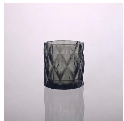
Bougeoir en verre diamant couleur unie