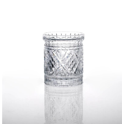
bougeoirs en relief unique décor à la maison