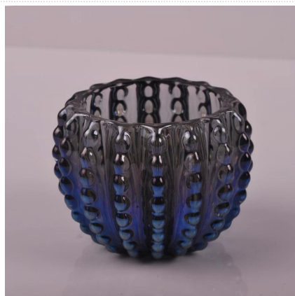
bougeoirs bande de points de verre