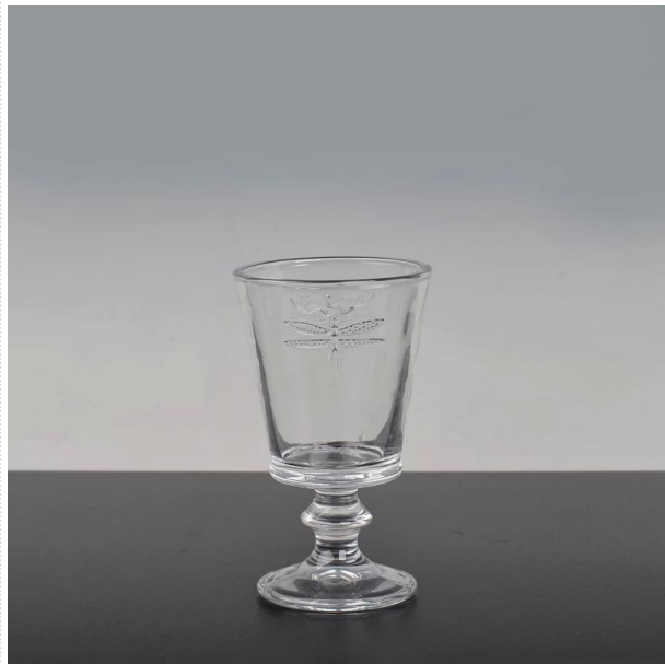
bougie verre de titulaire découle