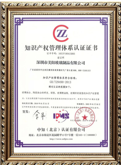
Propriété intellectuelle de l'entreprise N° de brevet : 201630655323.4