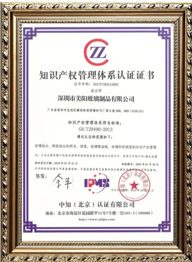
Propriété intellectuelle d'entreprise N ° de brevet: 20163065323.4