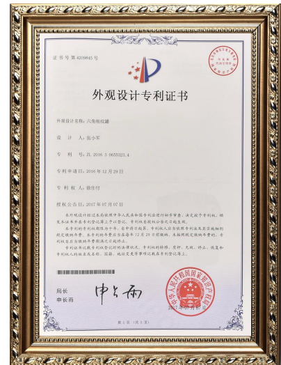
N° de brevet : 201630655323.4