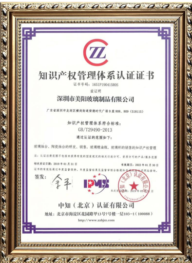
Propriété intellectuelle de l'entreprise N° de brevet : 201630655323.4