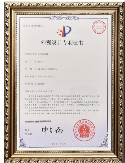
Numéro de brevet : 201630655323.4