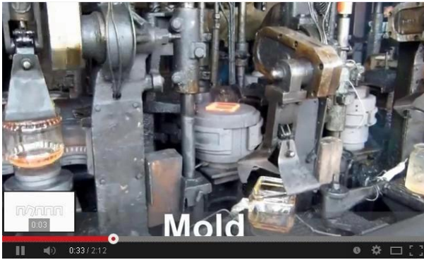
Technologie des machines IS