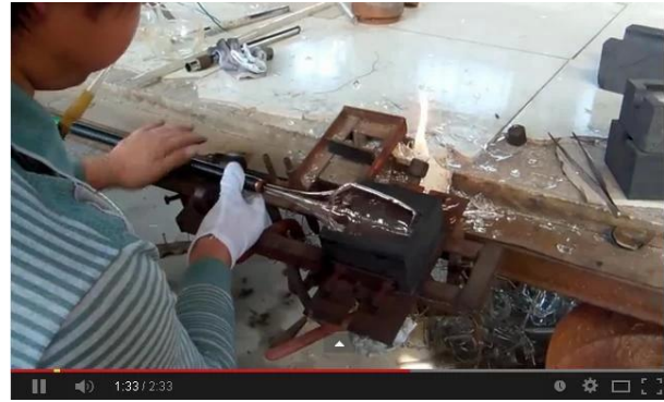
Technique de soufflage à la main