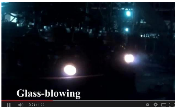
Technologie de soufflage à la machine

Par la présente, regardez notre vidéo de ligne de production en ligne, bienvenue pour nous rendre visite sur place.