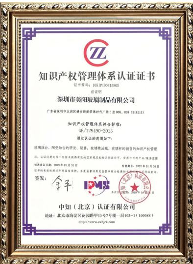
Propriété intellectuelle de l'entreprise N° de brevet : 201630655323.4