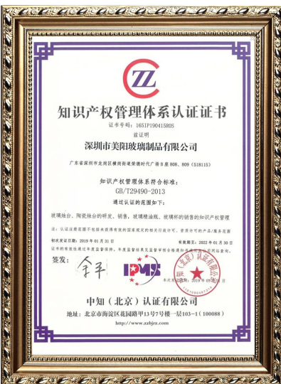
Propriété intellectuelle d'entreprise N ° de brevet: 20163065323.4