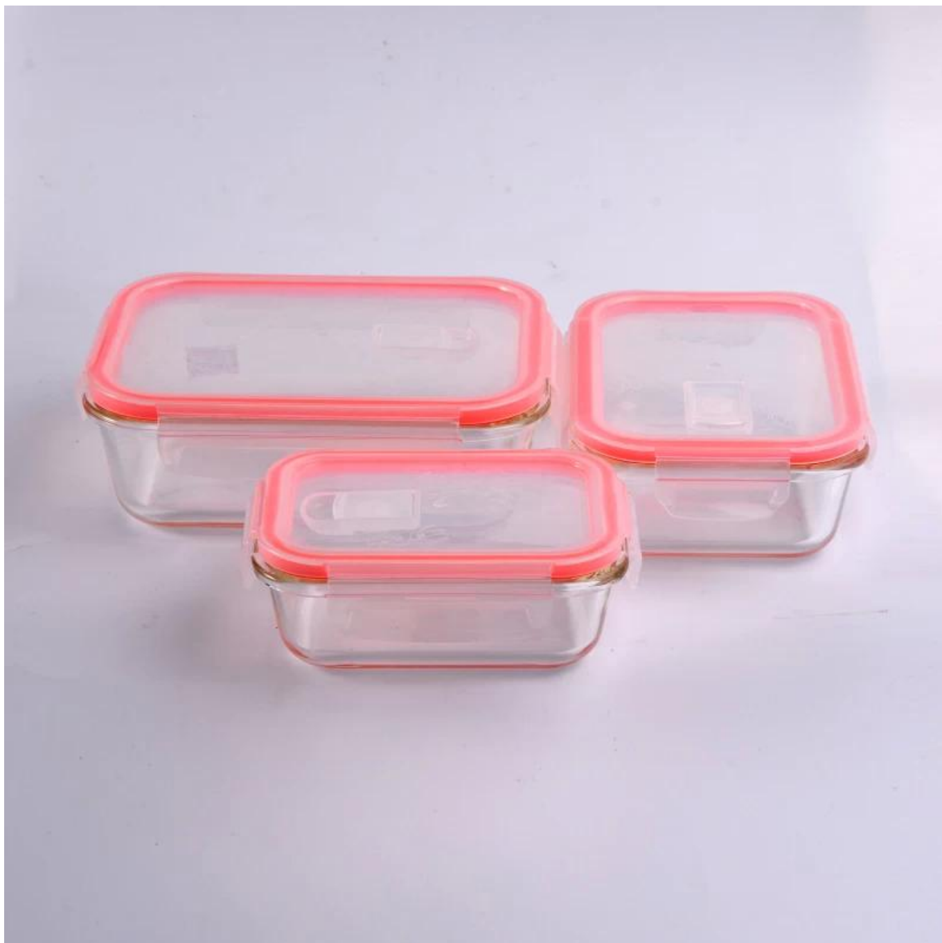
Différentes formes et couleurs de boîtes repas au choix.