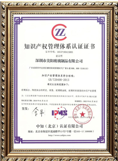
Propriété intellectuelle de l'entreprise N° de brevet : 201630655323.4