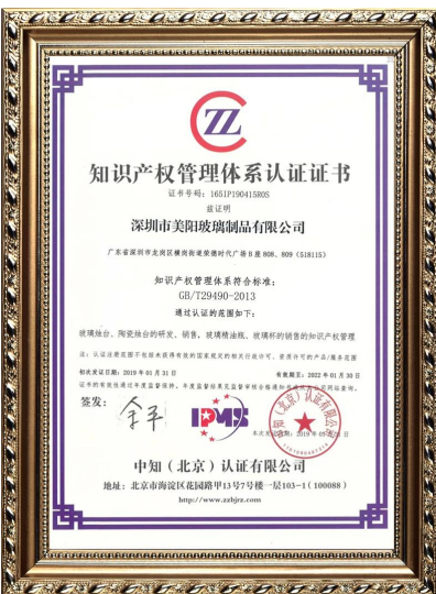
Propriété intellectuelle de l'entreprise N° de brevet : 201630655323.4