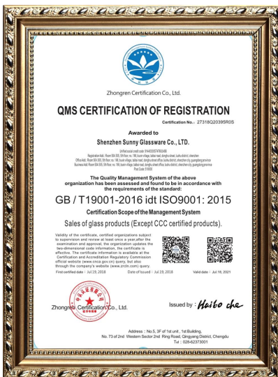
ISO 9001 : 2015