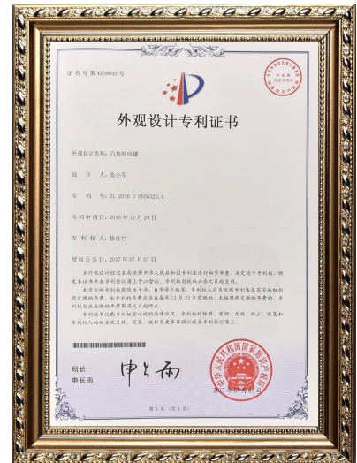
N.º de patente: 201630655323.4