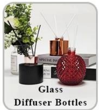
Glass Diffuser Bottles