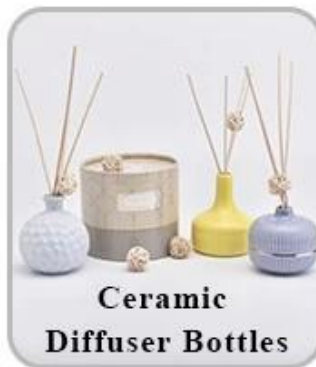
Ceramic Diffuser Bottles