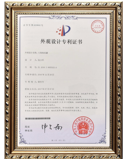
Número de patente: 201630655323.4