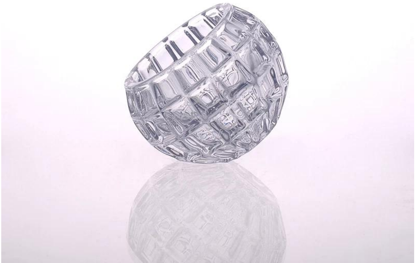
title = "candelabro de cristal claro de alta calidad"