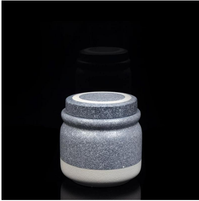
Titular de la vela de cerámica con acabados en mármol