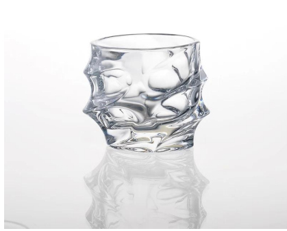
vela decoración de vidrio titular