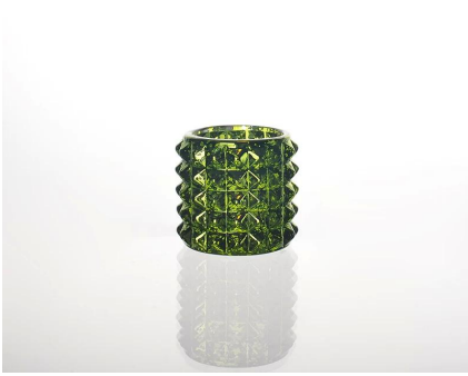
color vela de cristal taza