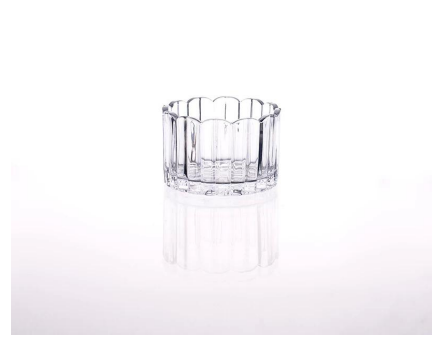
claro candelabro de cristal

S Our Company & Sample Room Every day is sunny day