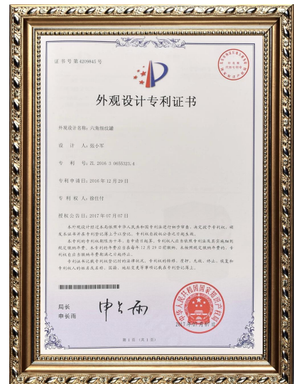
Número de patente: 201630655323.4