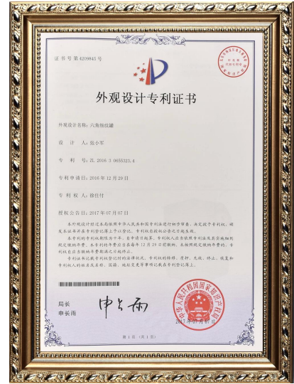
Número de patente: 201630655323.4