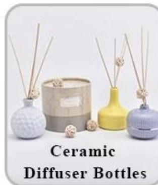
Ceramic Diffuser Bottles