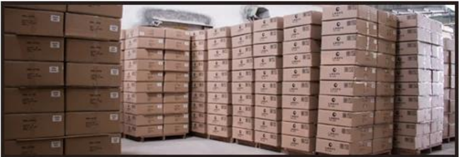
Ready to loading