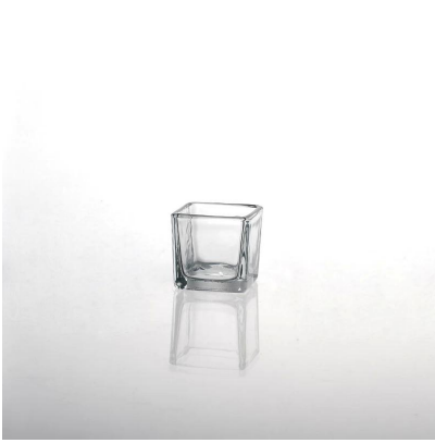
quadratische klar Glas Kerzenständer