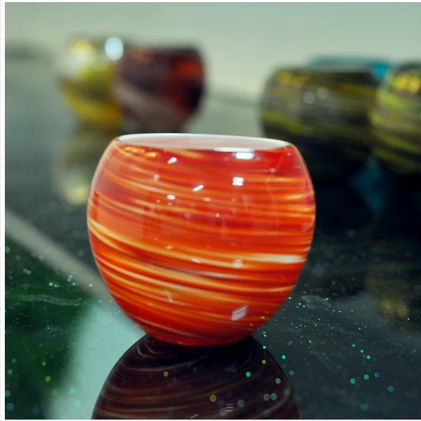
neue Kerzenhalter aus Glas