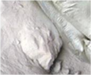
1、 Raw Material