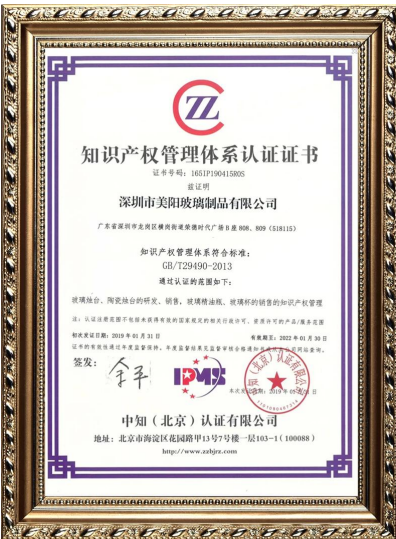
Geistiges Eigentum von Unternehmen Patent-Nr.: 201630655323.4