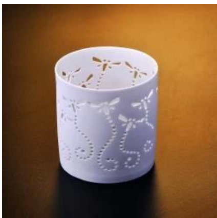
weiße Keramik Teelicht Kerzenhalter