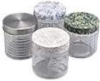
Metal with printing