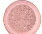
Zinc alloy embossed