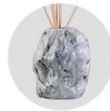
Water Transfer Printing