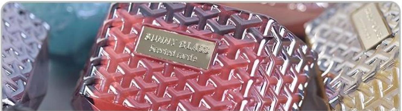
Glass Candle Holders