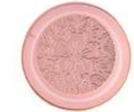
Zinc alloy embossed