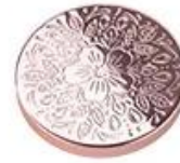
Zinc alloy embossed