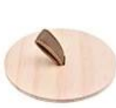
Pine wood lid