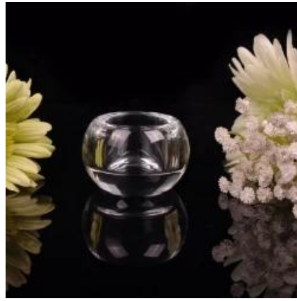
Rund kleine Teelichthalter