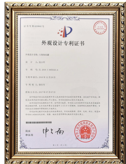
Patent Nr.: 20161630655323.4