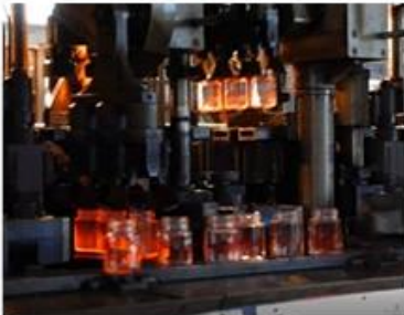
The ranks of machine